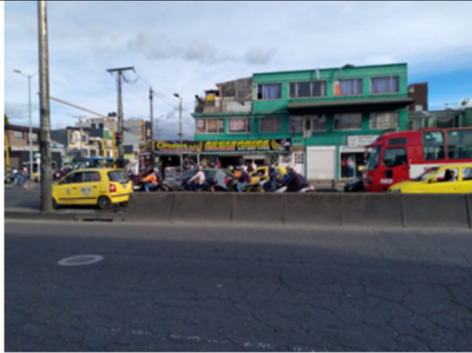
Foto 1. Vista frontal del predio en donde estaba ubicada la valla en la Avenida Calle 90 No 85 A- 29 (dirección catastral) orientación Sur- Norte