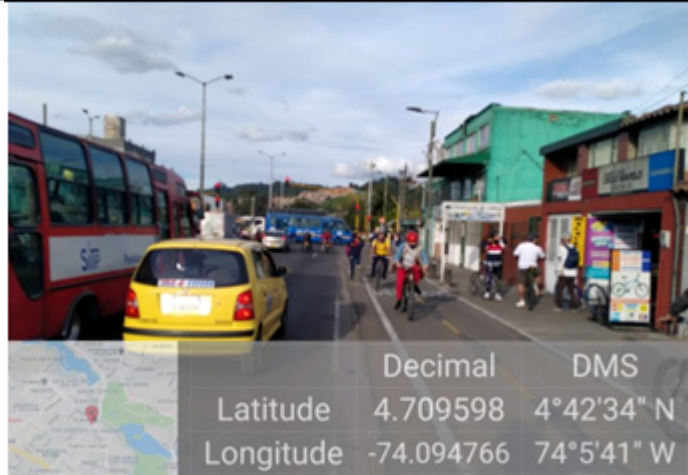
Foto 2. Vista panorámica del predio ubicado en la Avenida Calle 90 No 85 A- 29 (dirección catastral) orientación Sur- Norte, donde se evidencia que el elemento fue desmontado.